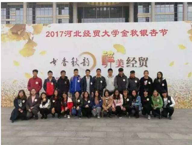
2017年第一届金秋银杏节

在教研室老师的带领下，星空会展工作室策划运营了河北省知名校园文化品牌活动：河北经贸大学金秋银杏节。截止2021年6月，金秋银杏节已成功举办四届，知名度和影响力逐年攀升，广受赞誉。