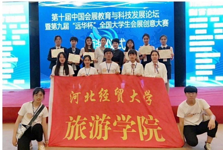
星空会展成员参加会展创意大赛并获得一等奖

星空工作室积极参与校内外组织的社会调研活动，先后赴北京车展、唐山世界园艺博览会、国家会议中心等会展场馆或展会调研，了解行业和企业现状，提高学生发现、分析问题与解决问题的能力。