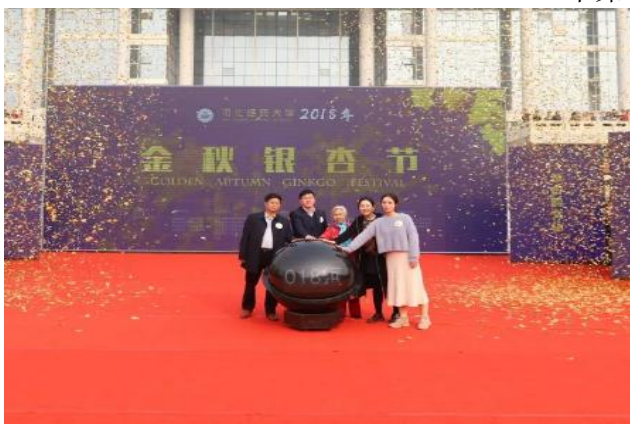
2018年第二届金秋银杏节