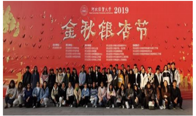
2019年第三届金秋银杏节