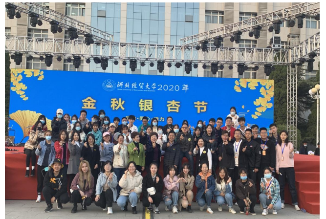
2020年第四届金秋银杏节

金秋银杏节通过组织丰富多彩，种类繁多的校园活动，丰富充实了校内师生的学习工作生活，为广大市民提供休闲娱乐，了解高校文化的平台。也是我校展示校园风采、高校文化、促进文旅融合、传承优秀文化的重要载体。